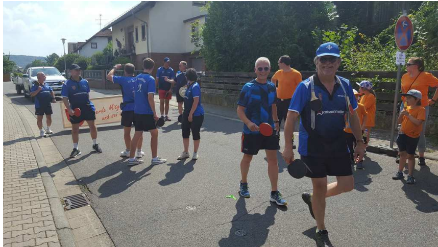
Ein Teil der Teilnehmer der Tischtennis- Abteilung am Michelsmarkt- Festzug

Einmal mehr, bei Top- Wetter, nahm eine Fußgruppe der Tischtennis- Abteilung mit Bollerwagen an dem diesjährigen Michelsmarkt- Festzug teil. Wie immer hatte jeder den Tischtennis- Schläger parat und es wurden wieder während des Umzuges Tischtennisbälle direkt zugespült. Dies zog die Aufmerksamkeit der Zuschauer an, was tlw. sogar mit Applaus bestätigt wurde. Ein paar weitere Bilder könnt ihr in der Rubrik "Bilder" sehen.