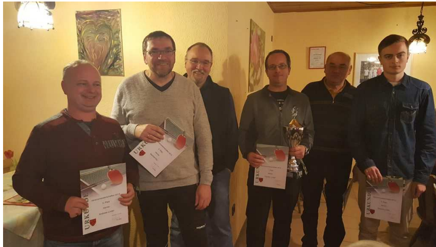
Siegerehrung der Vereinsmeisterschaft 2019: